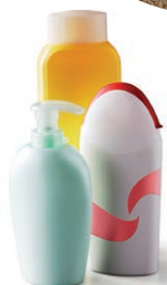
Flacons plastiques de produits de toilette