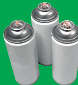
Aérosols non vides