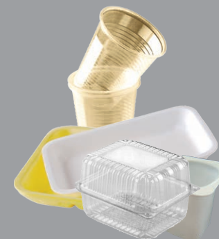
Petits emballages plastiques et polystyrènes