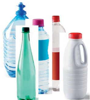
Bouteilles plastiques : eau, jus de fruit, lait, soda... avec les bouchons