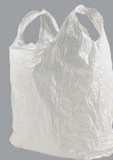
Films et sacs en plastique