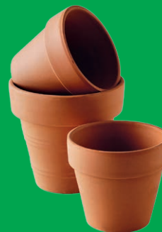
Pots de fleurs