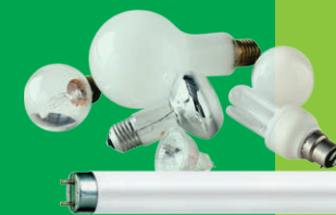
Ampoules et néons