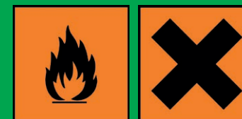
Flacons de produits portant ces symboles