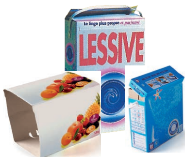
Boîtes et suremballages en cartonnette