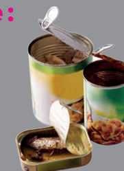
Conserves contenant des restes