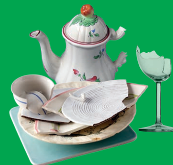
Vaisselle, faïence, porcelaine, cristal