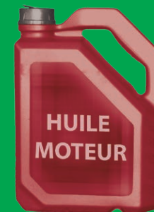
Bidons d'huile moteur

Encore un doute ? N'hésitez pas, Téléphonez-nous ! Numéro Azur : 0 810 440 500