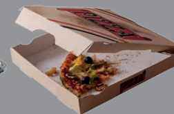
Papiers et cartons gras