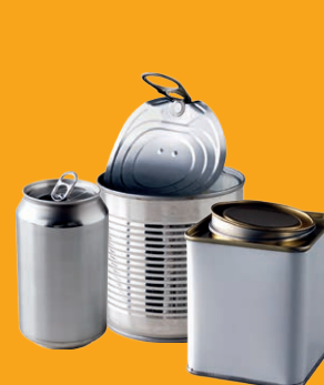
Boîtes et conserves métalliques

Je mets en vrac et vides dans la colonne à repère JAUNE :