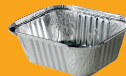
Barquettes alu propres