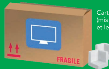
Cartons (mis à plat) et le polystyrène

Encore un doute ? N'hésitez pas, Téléphonez-nous ! Numéro Azur : 0 810 440 500