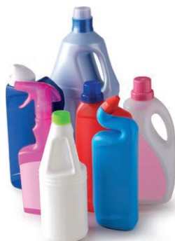
Flacons plastiques de produits ménagers avec les bouchons